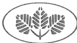
Wojewódzki FUNDUSZ OCHRONY ŚRODOWISKA i Gospodarki Wodnej w KATOWICACH